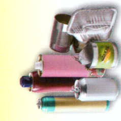
➤ Boîtes métalliques