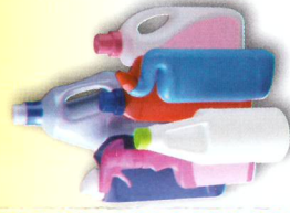
➤ Bouteilles en plastique