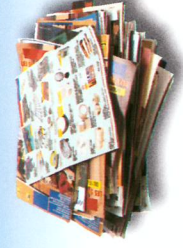
➤ Papiers, prospectus, journaux