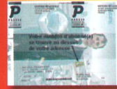
■ Films en plastique enveloppant les revues