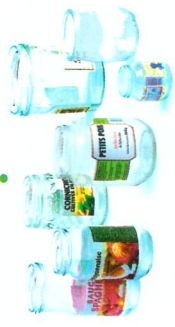
➤ Pots, bocaux en verre