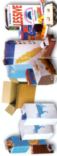
➤ Briques, petits cartons, cartonnettes, boîtes d'œufs