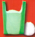
■ Films et sacs plastiques